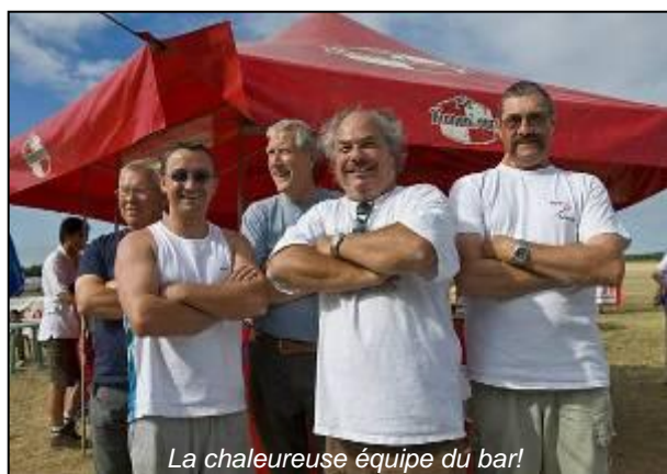
La chaleureuse équipe du bar!

Avant de ressortir de la base je prends un peu de pluie, ouf, c'était moins une! Les derniers km du circuit se déroulent très bien. Je me rends compte que j'ai fait le bon choix lorsque j'aperçois le paquet loin derrière et en contrebas... "Déposés !"